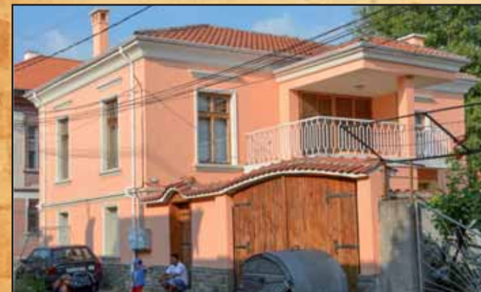
Uusi kotimme Bulgariassa.

Koska täytin 4 vuotta, juhlimme synttäreitani Suomessa neljä kertaa. Sain monta lahjaa ja paljon kakkua, vaikka en siitä pidäkään erityisesti. Minulle tuli ikävä pyörääni, kun olimme niin pitkään Suomessa. Täällä on kuuma ja hikininen ilma.