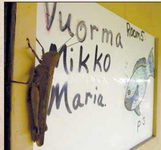
Heinäsiirkat ovat isoja ja kovaäänisiä.

Tässä muutamia välähdyksiä heidän nykytaipaleestaan.