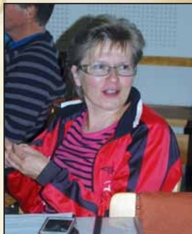
Lea toimii yhdyshenkilönä ryhmän sisällä ja hoitaa myös yhteydet ulospäin.

Heikon Ihmisen lauluryhmää kävi jututtamassa Reijo Pulkkinen