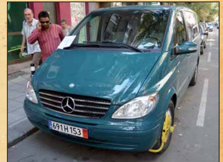
Uuden auton ensimmäinen pysäköintisakko.

Hristo Botev uliça 17, 4550 Peshtera, Pazacik, Bulgaria